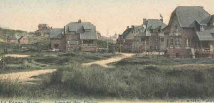
La Panne - Bains - Avenue des Dunes

Naast de neostijlen, die zich beperken tot het teruggrijpen naar één enkele stijlbron of -periode, ontwikkelt zich in de tweede helft van de 19de eeuw ook de eclectische beweging. Binnen het eclecticisme worden voor één gebouw elementen van verschillende stijlen samengevoegd om een bepaald effect te bereiken. Deze mengstijl geeft aanleiding tot de meest eigenaardige fantasieën.